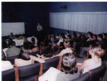
Estudiantes de la asistentes a la charla.

Recomendó también, que las cadenas hoteleras desarrollen programas conjuntos (Empresa-Académica) que podrán denominarse “Proyecto de desarrollo integral turístico-hoteler”, en donde los estudiantes interactúen con los hoteles o empresas operativas a