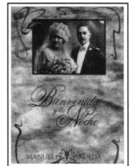
Portada del libro “Bienvenida y la noche” del escritor Manuel Rueda