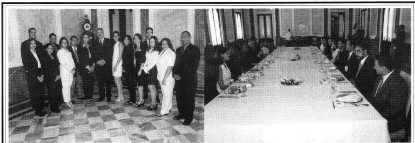
Visita y almuerzo de cortesía ofrecido por el excelentísimo señor vicepresidente de la República, doctor Jaime David Fernández Mirabal a estudiantes de la Escuela de Administración de Empresas Turísticas y Hoteleras de UNIBE.

Coincidieron en resaltar que el turismo es una fuente primaria de ingresos económicos; de ahí la importancia de garantizar el desarrollo de éste y el de los futuros profesionales, en aras del crecimiento integral de la nación.