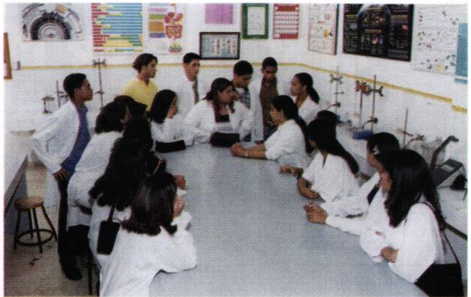
Grupo de estudiantes del bachillerato participando en el Programa "Médicos del Mañana".

En cuanto al componente académico, la facultad de medicina está integrada por aproximadamente 200 docentes, quienes inmersos en su actividad están identificados con nuestra filosofía y misión de formar un profesional con capacidad resolutive, cuyo desempeño profesional vaya acorde con la demanda del mundo actual.