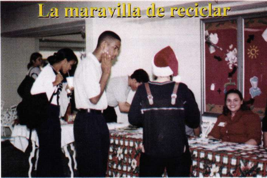
Estudiantes observan las tarjetas de navidad en la mesa de exposición

Aunque tiene poco tiempo de fundado, el Grupo Ecológico de UNIBE se ha destacado en su lucha por proteger el medio ambiente, tanto dentro del recinto universitario como fuera de él, a través de excursiones a los parques nacionales del país.