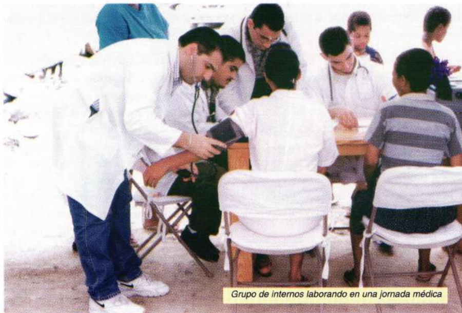
Grupo de internos laborando en una jornada médica

En los próximos días se inaugurará el nuevo Salón de Estudios, ubicado en el tercer piso de la torre de parqueo. Esta nueva instalación, la cual será dotada de mobiliario,