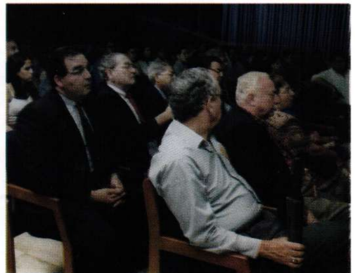
Grupo de los asistentes a ciclo de conferencias Médicas. Salón de Actos UNIBE