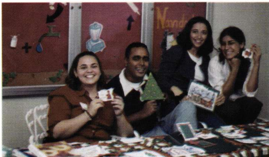
Jóvenes miembros del GEU en un momento de descanso en la jornada de venta