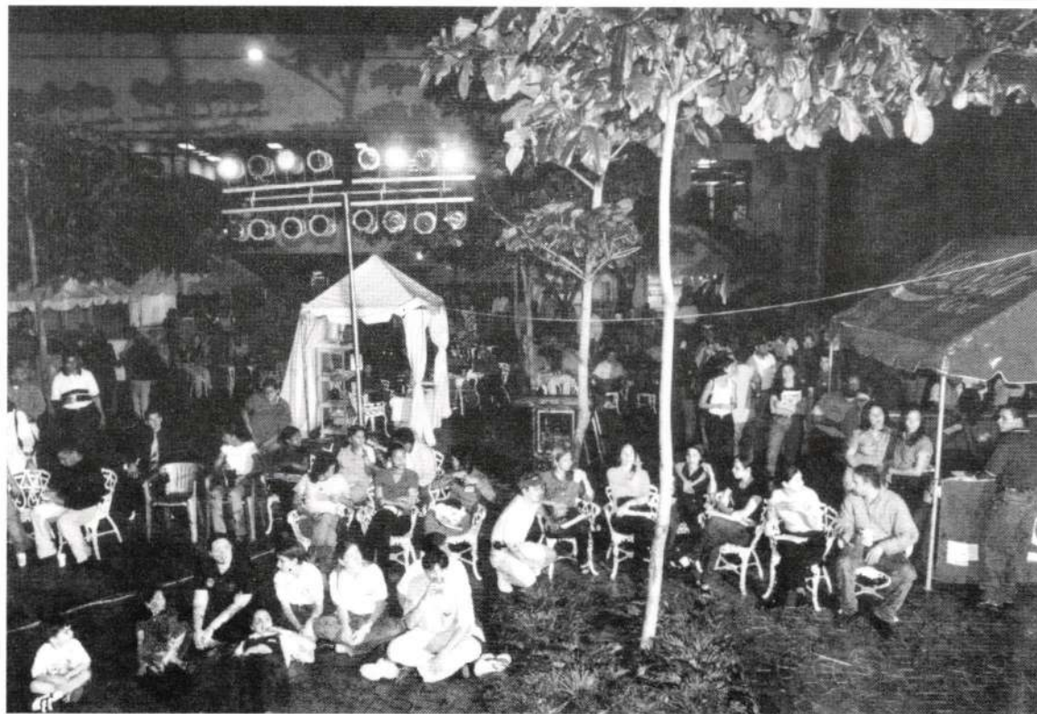
La escuela de Mercadeo celebró los días 24, 25 y 26 de marzo, en la explanada central de Unibe, Mercadexpo 99. La actividad fue organizada por estudiantes de la carrera y en ella se ofreció a los visitantes información y facilidades sobre diversos productos y servicios, aplicando las más modernas técnicas de marketing. Se lucieron atractivas y coloridas carpas y cada tarde se llenó de alegría con espectáculos de aeróbicos, desfile de modas, artistas... La foto muestra un momento en que el público disfruta de una de las presentaciones.

El DIC solicita a los profesores de UNIBE interesados en presentar proyectos de investigación que se comuniquen con el doctor Hernández, en la extensión 227 o en la 231.