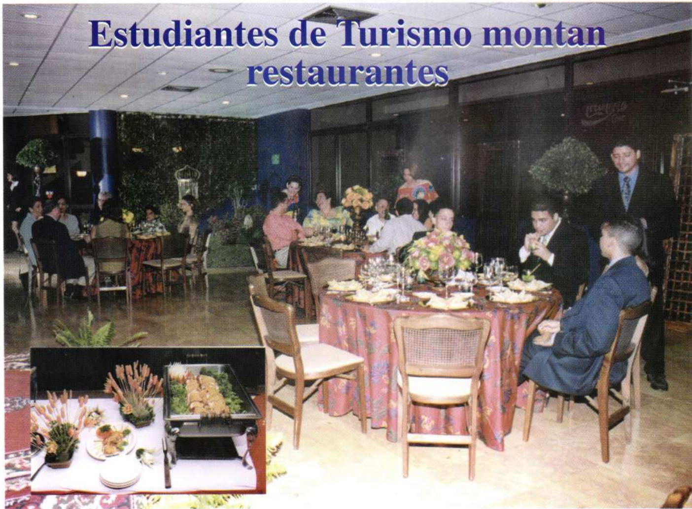
Ambientación restaurant Rodizzio Brasileiro e invitados.

Con el objetivo de profundizar los conceptos teórico-prácticos sobre la Cocina Criolla e Internacional, y a fin de proveer técnicas y herramientas necesarias para la administración exitosa de restaurantes, fueron celebrados recientemente dos actividades bajo la supervisión de la asignatura COCINA II.