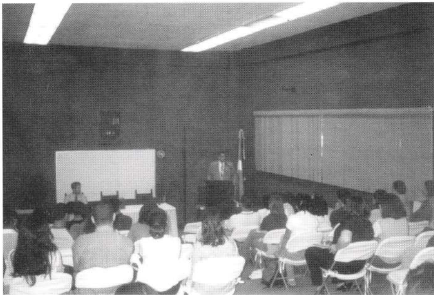
Teniente Coronel Santana Páez, de la Policía Nacional mientras se dirige a los estudiantes en el aula 204 de Unibe.

La actividad, que se inició a las 10:00 de la mañana, se desarrolló con éxito y muchos de los presentes se notaban muy interesados en el tema. Al finalizar se ofreció un sabroso desayuno a cargo de los organizadores.