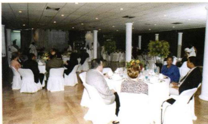
Invitados disfrutan del restaurant Olimpo.

a cargo de los estudiantes quienes ocuparon posiciones de Gerentes Administrativos, Chef Ejecutivo, Gerente de Bares, Gerente de Compras, Gerente de Servicios, entre otros, como en un establecimiento Gourmet real.