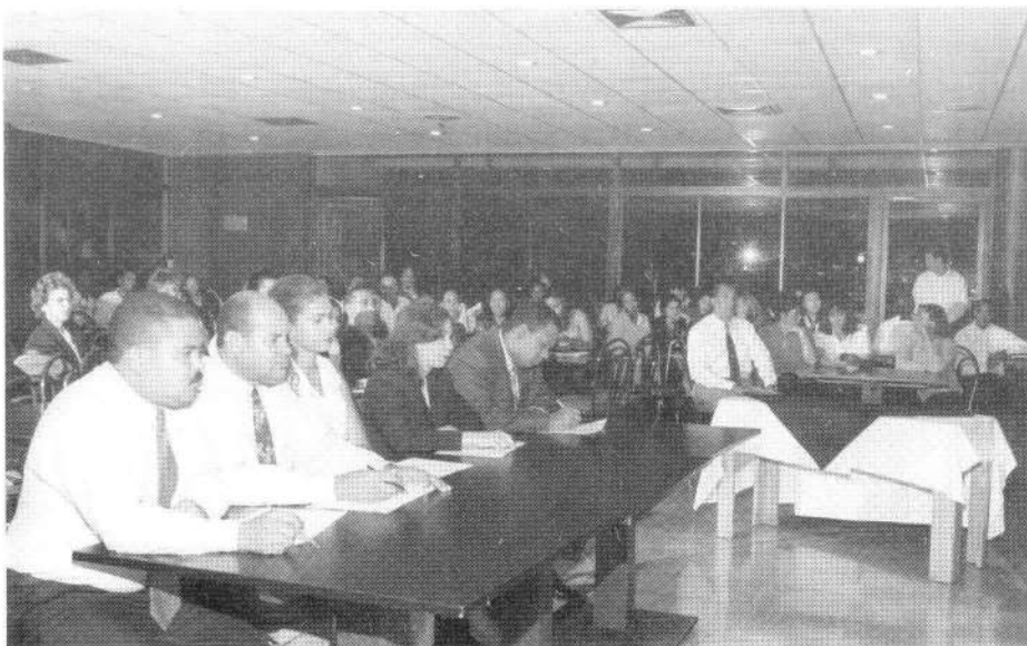
Miembros del Jurado y público presente