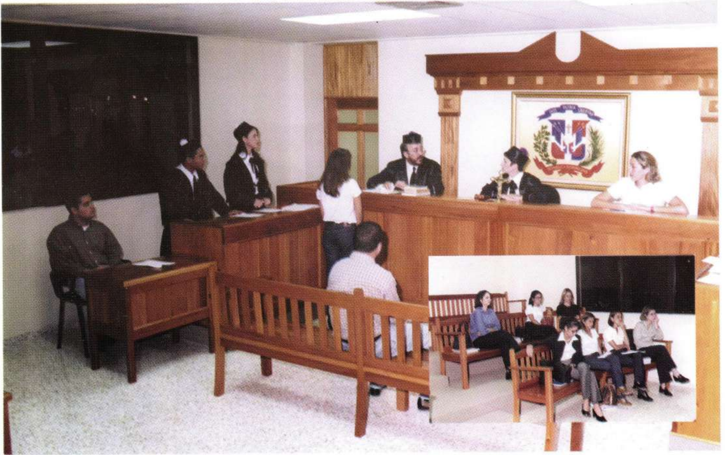
Momentos en que se escenifica un proceso penal en el Tribunal Docente.