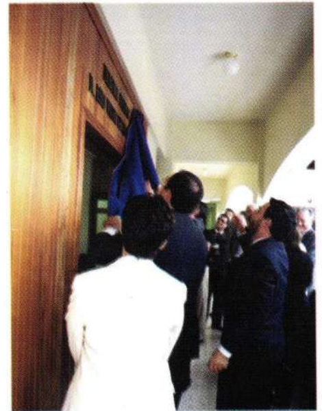
Momento en que se develiza la inscripción que identifica el Tribunal Docente “Dr. Luis Víctor García de Peña”.

Desarrollar este aspecto es muy importante, en este momento para la formación del futuro abogado, pues en la medida en que los ciudadanos comienzan a recobrar la confianza y credibilidad en la justicia, con más frecuencia la colectividad apoderará a los jueces y tribunales para dirimir sus conflictos. Por tanto, se hace necesario que nuestros estudiantes dominen