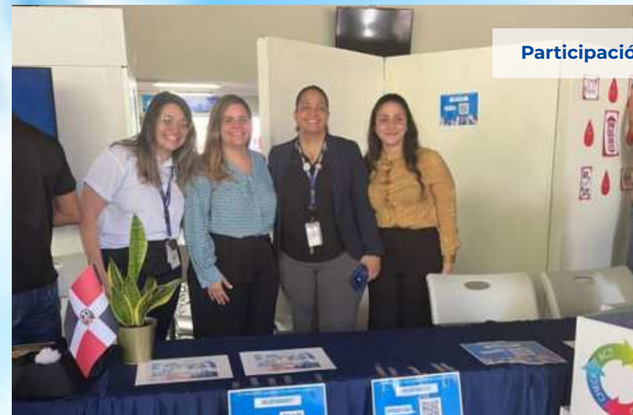
Participación de la VVI en los grupos estudiantiles