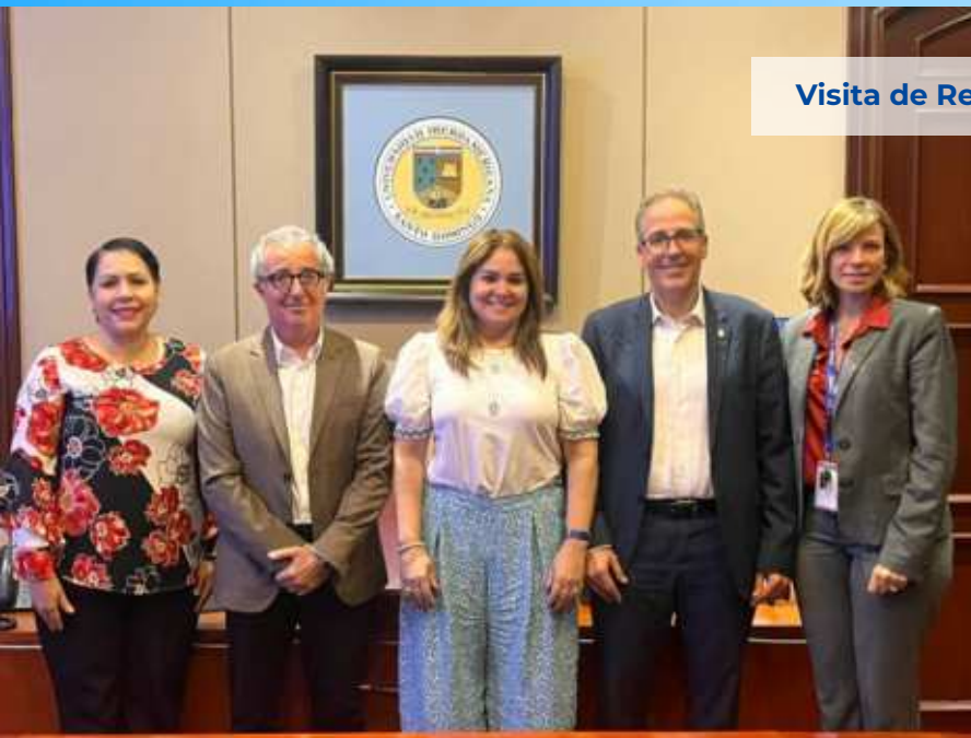
Visita de Representante de Universidad de Barcelona