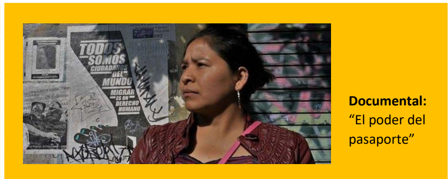
Documental: “El poder del pasaporte”