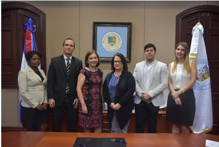
✓ Compañía Operadora del Agua (TECCA)