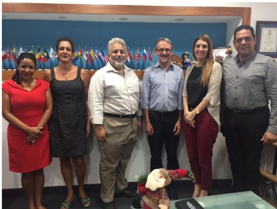
✓ Centro Federal de Educación Tecnológica de Minas Gerais, Brasil (CEFET-MG)