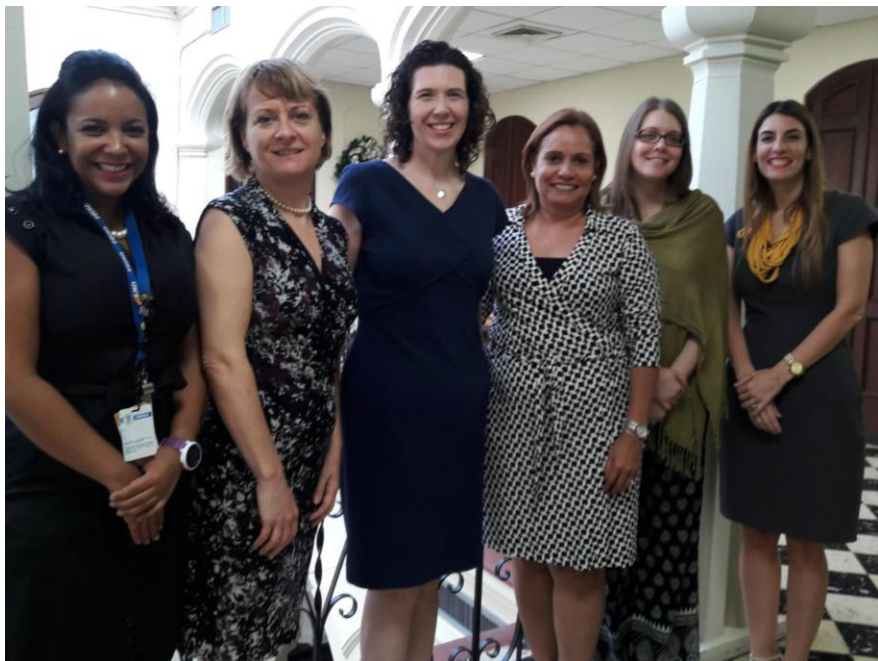
✓ St. John's University