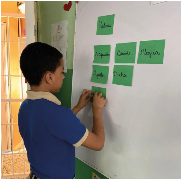
Taller Proyecto de Vida en la Escuela Patios de villa Aura durante el módulo “Conociendo mis emociones”.

“El lenguaje crea la realidad. Las palabras tienen poder. Habla siempre para crear alegría ”. Deepak Chopra