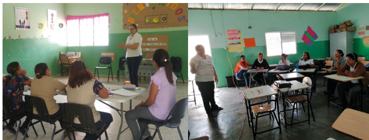
Taller Plan Escuela Segura Escuela Bacuí Abajo y Escuela El Túnel

Como una de las primeras acciones se propone trabajar en el taller dirigido a la comunidad escolar, en el que se planteen las situaciones relacionadas a temas de inclusión y violencia en el centro, realizar una lluvia de ideas de posibles soluciones a los mismos y conceptos claves en relación al clima social escolar positivo. En el anexo 5, se plantea una propuesta de agenda para desarrollar el Taller Plan Escuela Segura en el centro.