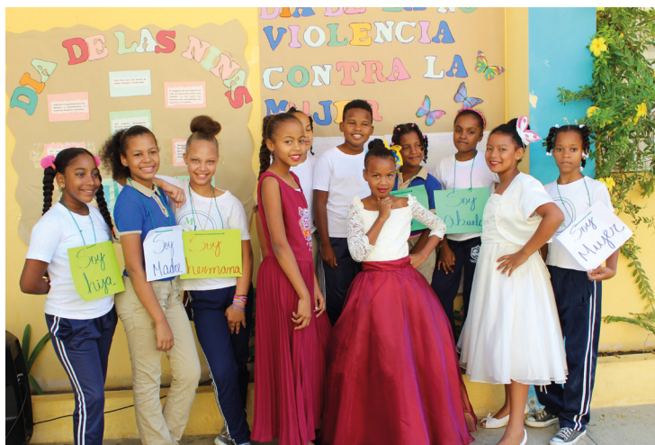
Dramatización del libro "En el tiempo de las mariposas" en conmemoración del Día de la No Violencia contra la Mujer, Escuela Martin Luther King

Estas son algunas de las efemérides planteadas y/o fechas señaladas en el Calendario Escolar del MINERD que apoyan estos temas: