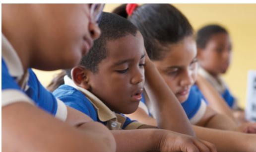
P.A.N.A.s del Centro Educativo Doña Emma Balaguer