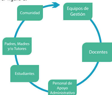
Figura 1. Ámbitos de intervención del componente GISS.

Las acciones del componente GISS se articulan en los diferentes niveles de la comunidad educativa: dirección, docentes, personal, estudiantes, padres y comunidad. Ver figura 1.