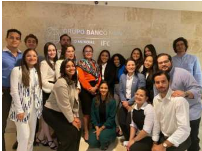
Visita al Banco Mundial

Exponer a nuestros estudiantes al mercado laboral es uno de los pilares educativos del BBA. La visita al banco mundial en Santo Domingo, fue una experiencia enriquecedora para nuestros estudiantes. Pudieron conocer mas sobre esta institución, asi como los diferentes programas y servicios que ofrecen. Cabe destacar las diferentes oportunidades laborales que ofrece el Banco Mundial para nuestros estudiantes y egresados del BBA.