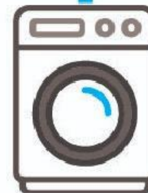
LAVADORA DE ROPA