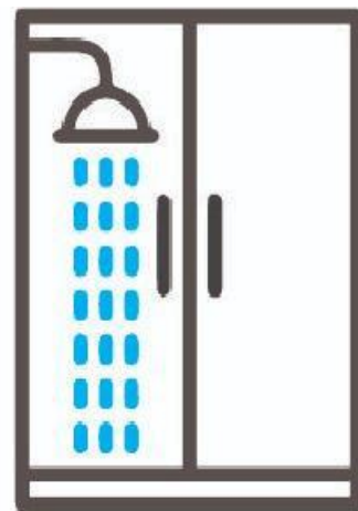
AGUA DE LA DUCHA