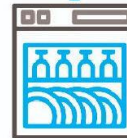
LAVADORA DE PLATOS