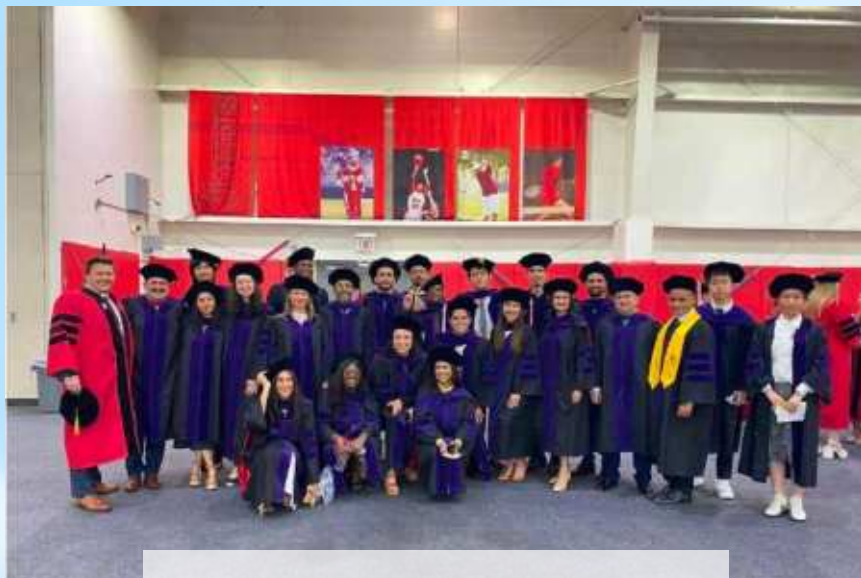
Estudiantes de Doble Titulación St. Johns School of Law, Estados Unidos.