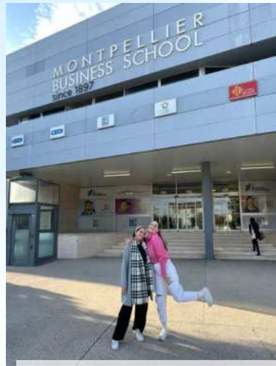
Estudiantes de Doble Titulación Montpellier Bussines School, Francia.