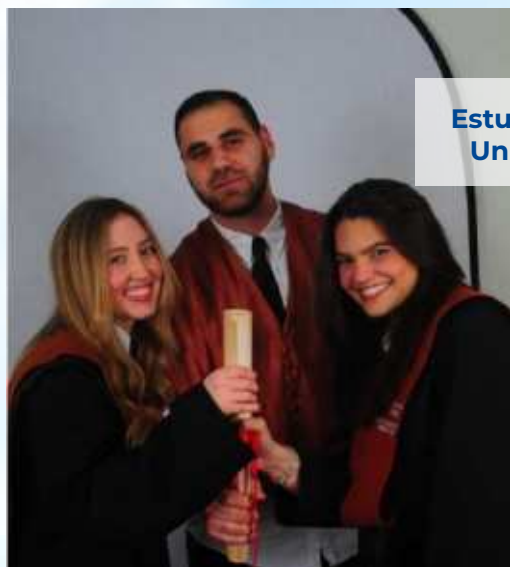
Estudiantes de Doble Titulación Universidad Europea, España.