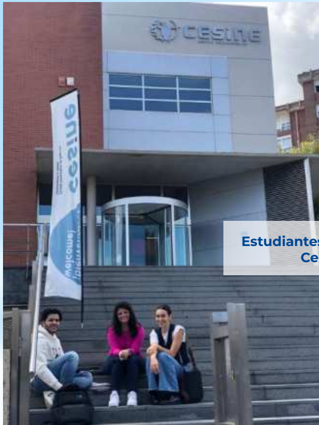
Estudiantes de Doble Titulación Cesine, España.