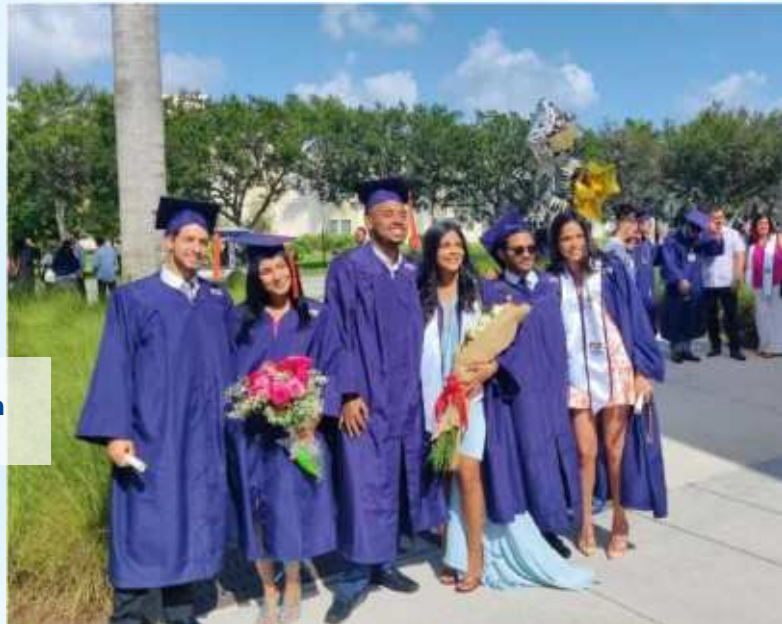
Estudiantes de Doble Titulación FIU, Florida.