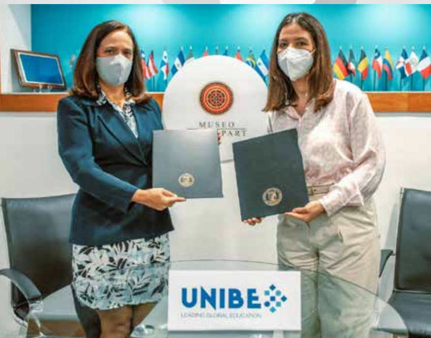
AGENCIA BELLA / MUSEO BELLAPART