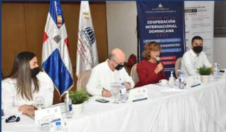
DIÁLOGO de Acción para la Cooperación Eficaz al Desarrollo 2021.