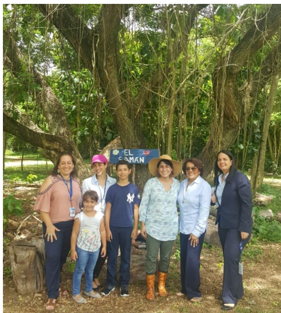
✓ Fundación Ser ECO