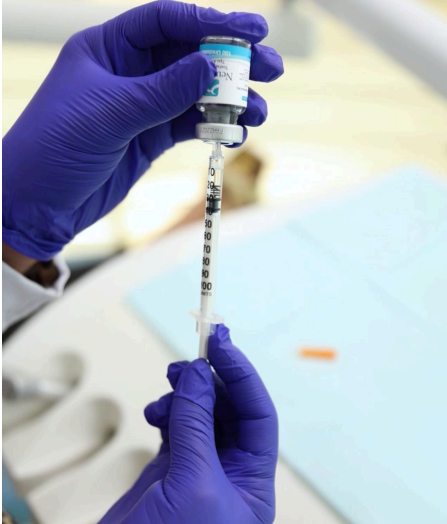
Figura 5: Preparación de toxina botulínica.

neuromusculares, infecciones locales y alergia a componentes de la fórmula. (Fig. 5). 14, 23