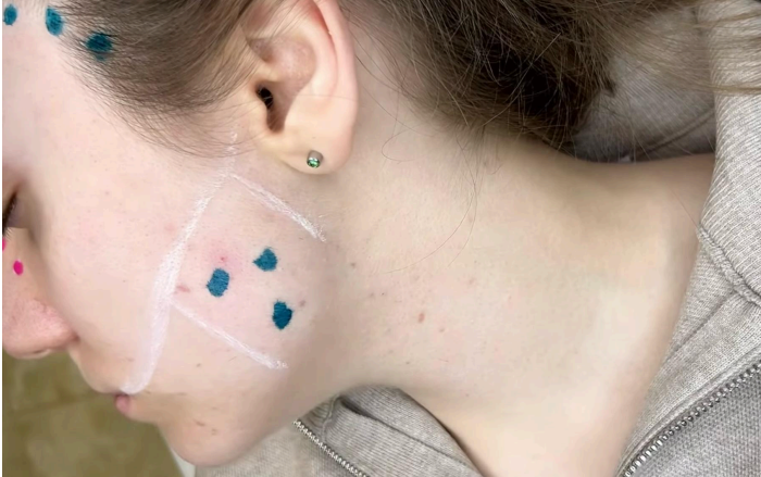
Figura 9: Marcación para aplicación de toxina botulínica para tratamiento de bruxismo.

Fuente: Yurttaş N, Doğan A. Efficacy of botulinum toxin-A treatment in patients with bruxism: A systematic review. Arch Oral Biol. 2022;133:105328.