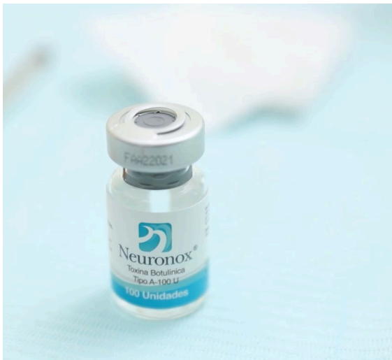
Figura 4: Toxina botulínica comercial.

pteroideo lateral requiere abordaje extraoral (a través de la escotadura sigmoidea) o intraoral, siendo técnicamente más complejo. Es crucial evitar estructuras vasculares y el nervio facial. Se utilizan jeringas de insulina con agujas 30G y la inyección debe realizarse perpendicular al músculo, previa antisepsia. Técnicas guiadas por ultrasonido o electromiografía pueden aumentar la precisión, especialmente en músculos profundos. (Fig. 4). 11, 20, 21