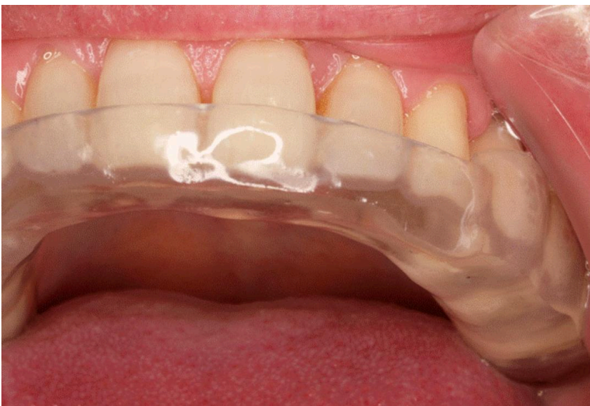
Figura 3: Férula oclusal.

Fuente: Nayyar P, Kumar P, Nayyar PV, Singh A. Botox: Broadening the horizon of dentistry. J Clin Diagn