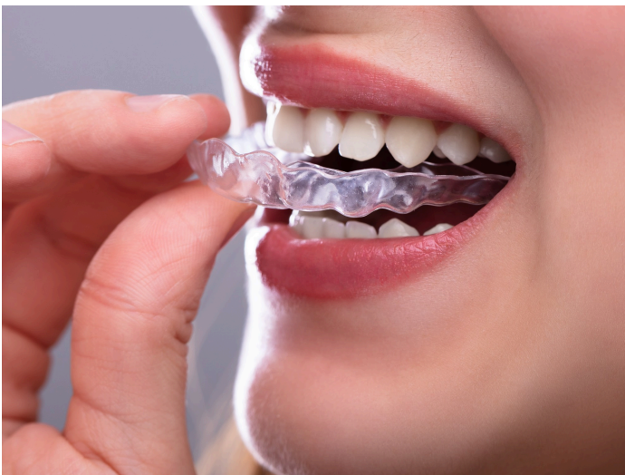
Figura 8: Férula oclusal para tratamiento de bruxismo.

Fuente: Deniz Yalçın E, Onder ME. Effect of botulinum toxin-A combined with occlusal splint therapy on sleep bruxism. Cranio . 2022;40(2):138-143.