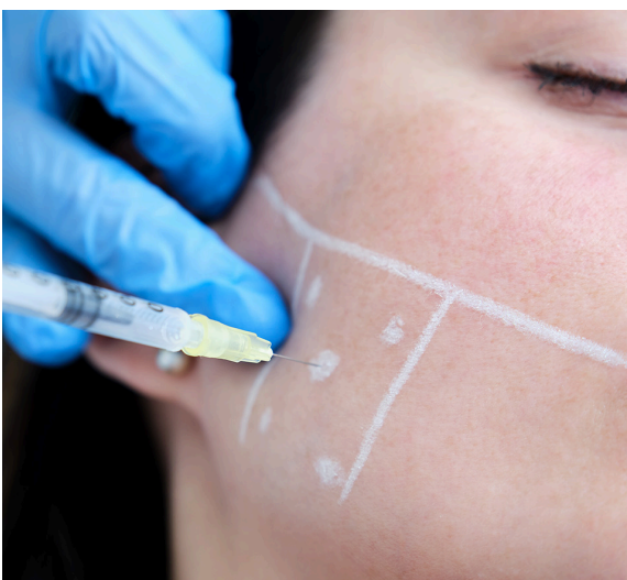
Figura 7: Aplicación de toxina botulínica en músculo masetero para tratamiento de bruxismo.