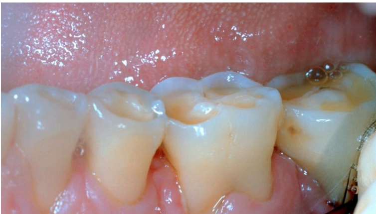
Figura 1: Piezas dentales desgastadas por bruxismo crónico.

Fuente: Chen M, Chen DC, Jiang Q, Liu XD, Liu W, Liu LK, et al. Exploring the etiology and treatment modalities of bruxism: An evidence-based review. J Int Med Res. 2021;49(8):3000605211022096.