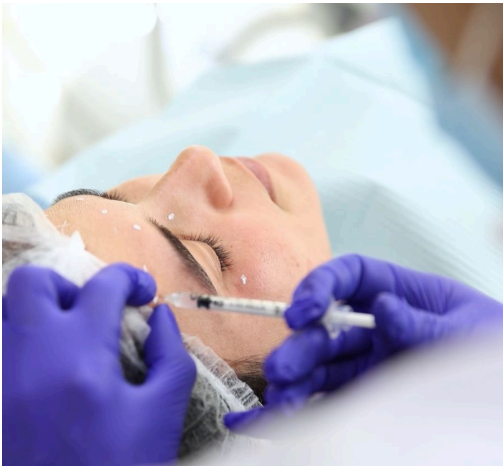
Figura 6: Aplicación de toxina botulínica.

toxina reduce significativamente la intensidad de las contracciones musculares durante los episodios de bruxismo, la férula optimiza las relaciones oclusales y proporciona una protección física continua, especialmente importante durante la fase inicial cuando la toxina aún no ha alcanzado su efecto máximo y durante la fase final cuando su efecto comienza a disminuir. (Fig. 7). 13, 19