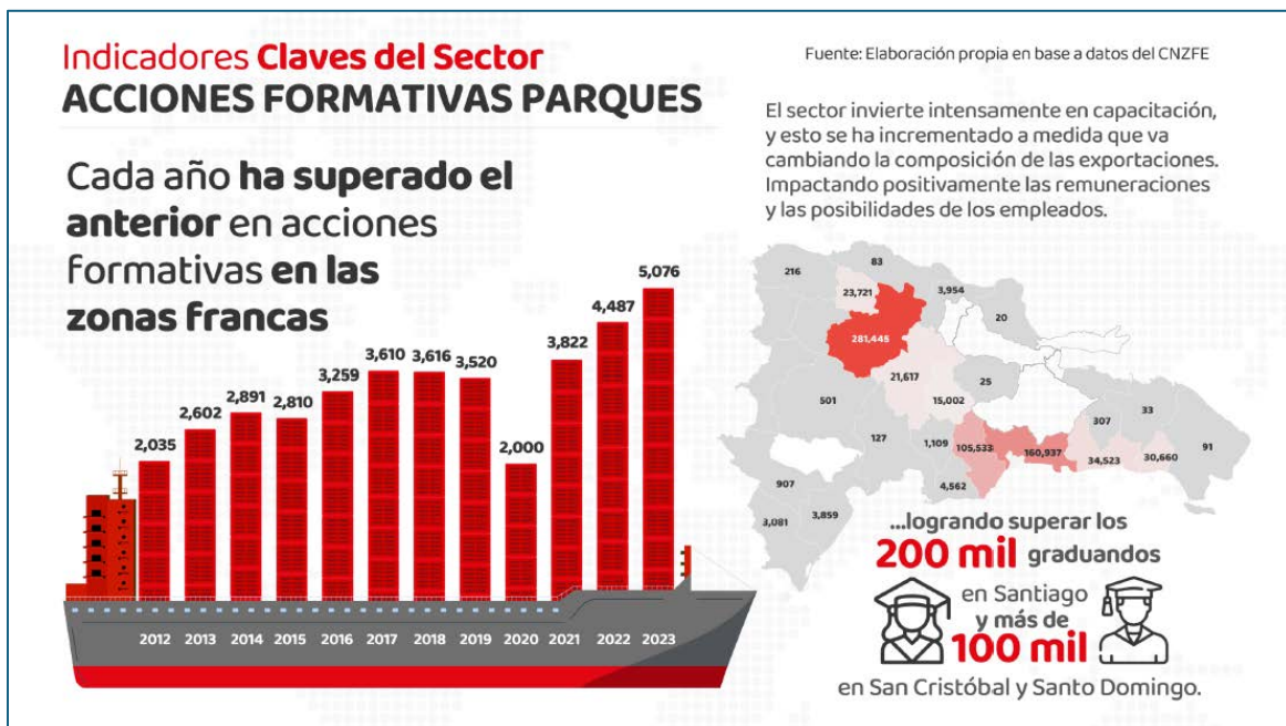
Ilustración 1: Indicadores acciones formativas del Sector Zonas Francas al año 2023 República Dominicana.