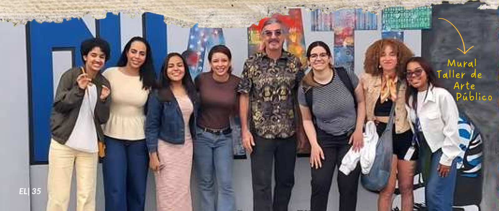
Mural Taller de Arte Público