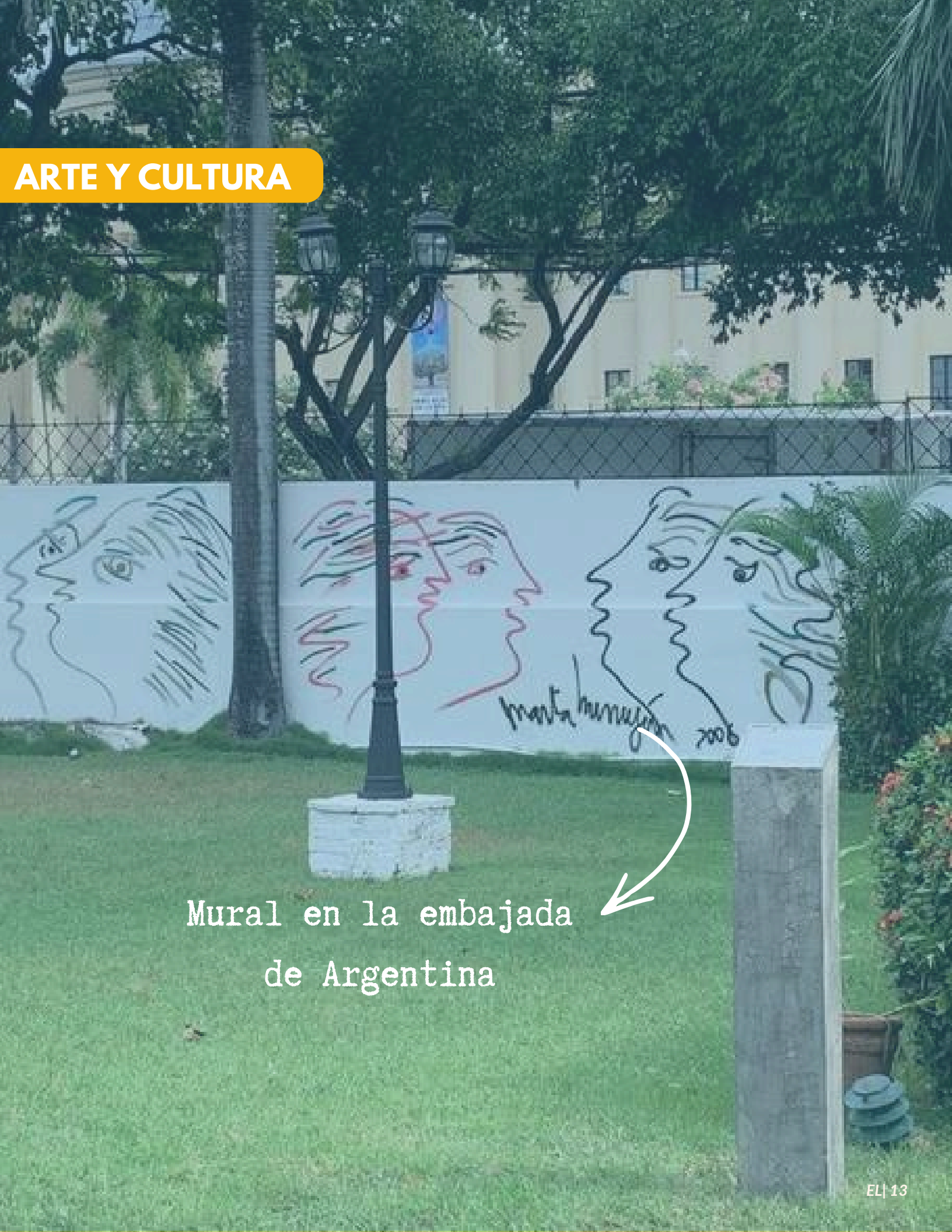
Mural en la embajada de Argentina