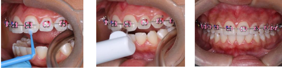
Figura 3: Colocación Clinpro™ XT Varnish (3M ESPE).

Este se aplicó una sola vez durante todo el estudio. A todos los pacientes se les explicó las instrucciones de higiene oral durante el tratamiento de ortodoncia y las indicaciones a seguir dicho día, no comer ni beber mínimo una hora luego de la aplicación del barniz fluorado.