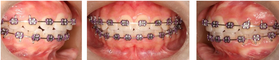
Figura 6: Fotos intraorales T4