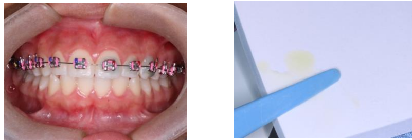
Figura 2: Colocación del ácido fosfórico al 37% y Mezclado de Clinpro™ XT Varnish (3M ESPE).

El día de la instalación ortodóntica, luego de haber pulido con piedra pómez, se realizó la instalación de la aparatología fija con otros colaboradores, utilizando Transbond XT fotocurable (3M Unitek, Monrovia, CA, USA), ácido fosfórico al 37% y brackets metálicos con la filosofía MBT (Dynaflex Lake St Louis, MO, USA), slot 0.022x0.028. Posteriormente, una de las investigadoras procedió a la colocación de barniz fluorado Clinpro™ XT Varnish (3M ESPE) en lado el de estudio, el mismo se eligió a conveniencia. Se limpió la superficie dental alrededor del brackets en el incisivo central, lateral y canino, se enjuagó con agua y se eliminó el exceso de humedad; se dispensó el barniz sobre la almohadilla y se mezcló durante 15 segundos con una espátula plástica (ver figura 2).