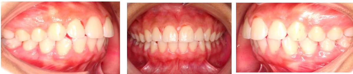
Figura 1: Fotos intraorales luego de la profilaxis.

En la primera cita se le explicó a cada paciente en qué consistía el estudio y también se obtuvo consentimiento informado y asentamiento. Ese mismo día se realizó un examen clínico, donde, bajo los criterios de inclusión y exclusión se valoraron las superficies vestibulares superiores de canino a canino y la salud gingival, esta última por un periodoncista de la unidad de Postgrados en Odontología de la Universidad Iberoamericana (UNIBE). La salud gingival, se evaluó mediante el índice gingival, utilizando una sonda periodontal Williams (Hu-friedy, Illinois, USA), el índice de placa y los sistemas de índice de retención por Harald Løe, donde GI 0= encía normal, GI 1= inflamación leve (ligero cambio en color, ligero edema sin sangrado), GI 2= inflamación moderada (enrojecimiento, edema, abultamiento y sangrado), GI 3= Inflamación severa (enrojecimiento marcado y edema, ulceración, tendencia al sangrado espontáneo). 68 Se realizó una profilaxis dental con pasta profiláctica, brocha y la pieza de mano de baja velocidad NSK (Tokyo, Japan) e instrucción de higiene oral. 68 Se tomaron fotos intraorales iniciales frontales y laterales con una distancia focal 32 y distancia de 50cm. 70 Para la fotografía dental se utilizó la cámara Canon EOS M50 Mark II (Tokyo, Japan), el Macro Ring Flash Yongnuo YN14EX II, (Shenzhen, China) y lente macro de 60mm (Canon EF-S 60 mm, F: 2.8, USM, Melville, Nueva York) (ver figura 1).