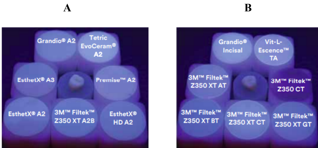
Figura 2: A: que corresponde a tonos de dentina, esmalte o cuerpo. B: Donde se muestran los tonos translúcidos o incisales.