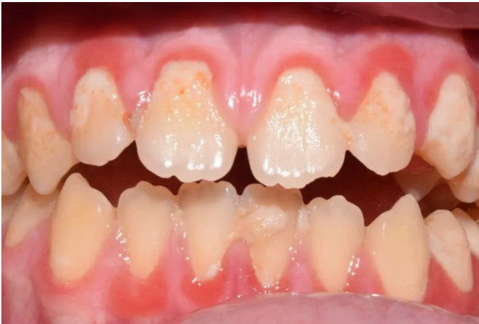
Figura 2: Paciente pediátrico con gingivitis y cálculo.

Fuente: Stankov K, Benc D, Draskovic D. Genetic and epigenetic factors in etiology of diabetes mellitus type 1. Pediatrics . 2017;132(6):1112–1122.