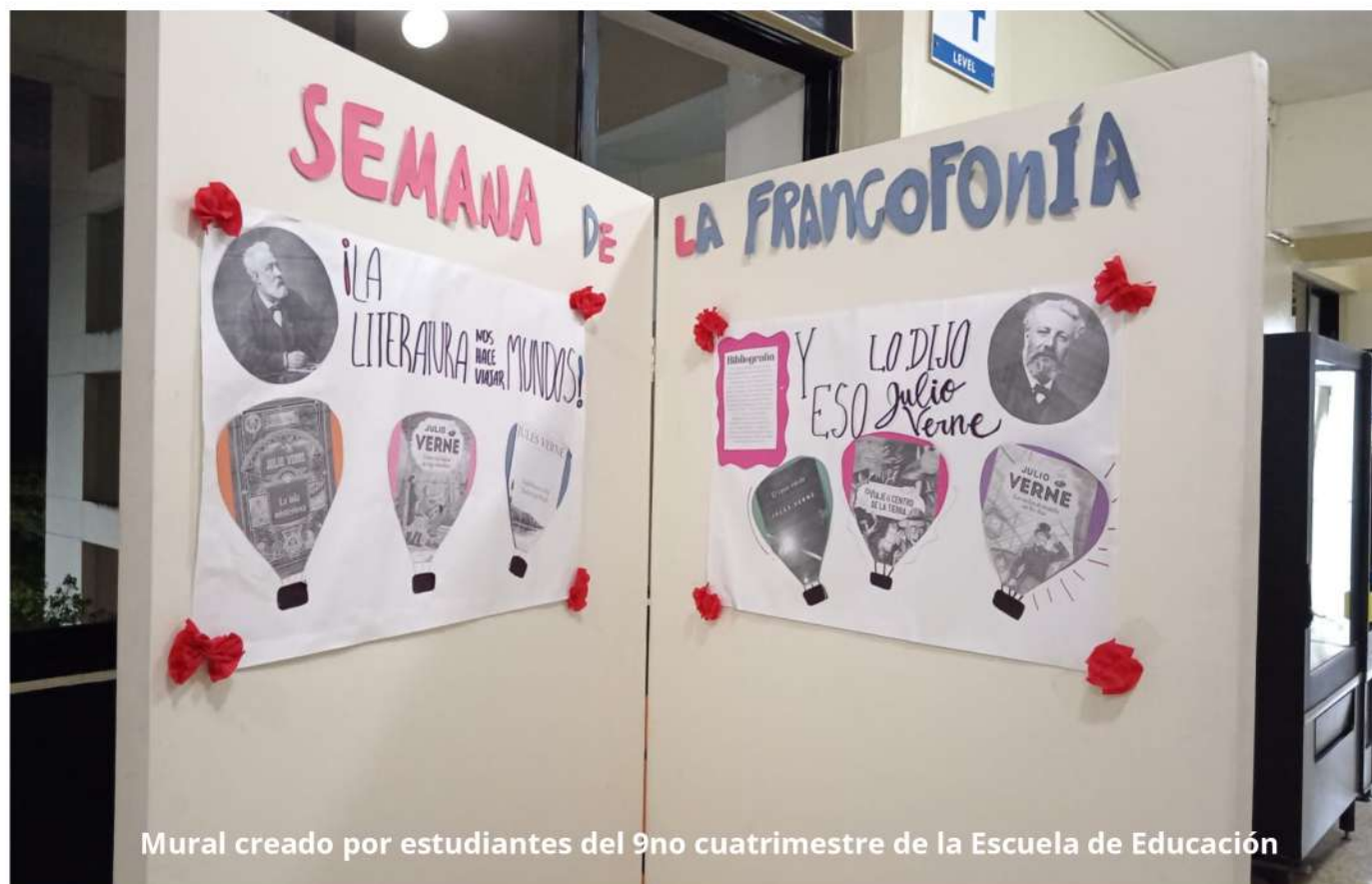
Mural creado por estudiantes del 9no cuatrimestre de la Escuela de Educación

El mural creado por las estudiantes del 9no cuatrimestre es una celebración vibrante de la obra de Julio Verne, un pionero de la literatura de ciencia ficción y aventura. Las estudiantes también han incorporado elementos visuales que reflejan la imaginación y el asombro que sus historias han provocado en generaciones de lectores.