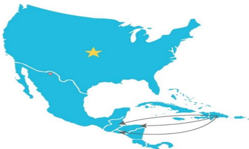
Mapa 2. Representación esquemática de la ruta terrestre conocida como “vuelta por México”.

De manera simultánea, la existencia de regímenes de exención de visado en países como Guatemala vigente hasta principios de 2023 y la posibilidad de ingresar sin visa a naciones como Honduras, El Salvador o Colombia para ciudadanos dominicanos, facilitaron la configuración de la denominada “vuelta por México” (Ver Mapa 2). Esta ruta consiste en salir de manera regular hacia un destino en Centroamérica, aprovechando políticas migratorias más flexibles, para luego emprender un recorrido por Mesoamérica con el objetivo de llegar a la frontera entre México y Estados Unidos y, desde allí, ingresar de forma irregular evitando los controles establecidos. Aunque se trata de un fenómeno más reciente en comparación con los viajes en yola hacia Puerto Rico, la “vuelta por México” ha ganado relevancia en los últimos años, posicionándose como una alternativa estratégica, aunque altamente riesgosa para acceder al territorio estadounidense (Méndez Isabel, 2024).