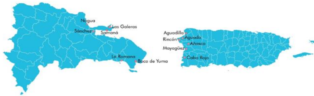
Mapa 1. Principales puntos de salida en República Dominicana y de llegada en Puerto Rico en la ruta marítima tradicional.

La transición desde la tradicional ruta marítima hacia Puerto Rico hacia rutas terrestres a través de Centroamérica y México representa un cambio sustancial en los patrones migratorios de los dominicanos durante la última década. Este giro geográfico ha sido impulsado por una combinación de factores estructurales, institucionales y simbólicos que reconfiguran tanto las decisiones de salida como las estrategias de tránsito migratorio. (Ver Mapa 1)