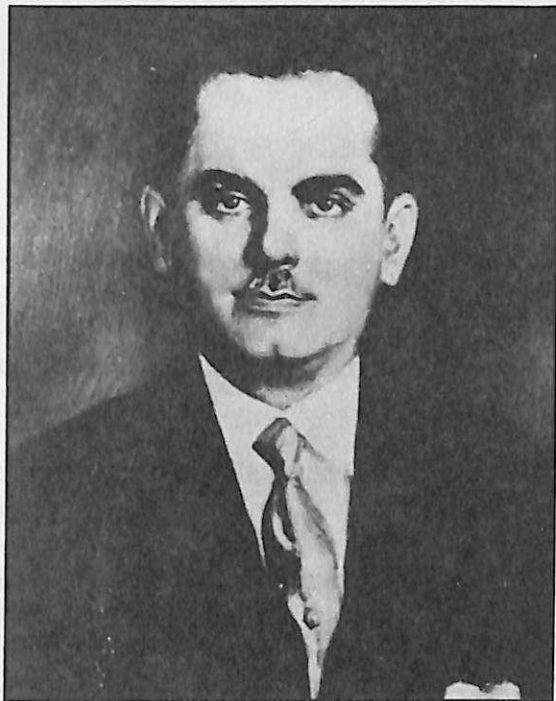
MANUEL A. PEÑA BATLLE 1902-1954