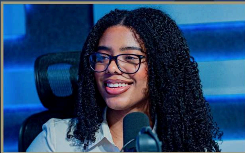
Top 6 de Mejores Oradoras en TONO 2024.