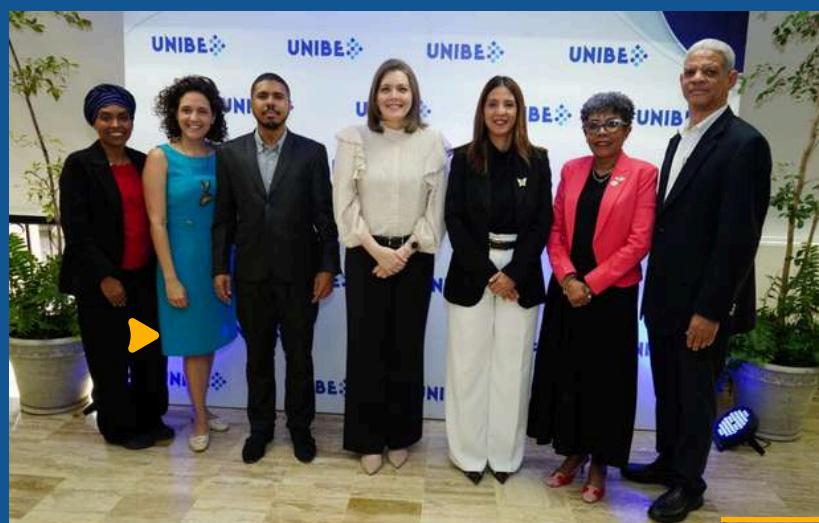
Panel de Mujeres Líderes en la Ciencia en conmemoración del Día Internacional de la Mujer